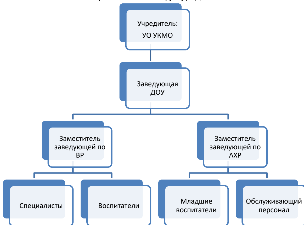
Организационная структура ДОО:

Система управления в ДОО обеспечивает оптимальное сочетание традиционных и современных тенденций: программирование деятельности ДОО в режиме развития, обеспечение инновационного процесса, комплексное сопровождение развития участников образовательной деятельности, что позволяет эффективно организовать образовательное пространство ДОО.